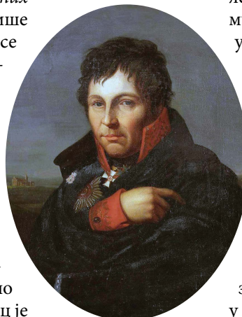
Герхард фон Шарнхорст (1755–1813)