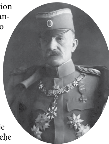
↑ Војвода Живојин Мишић (1855–1921)

Клаузевицеве идеје оствариле су потом утицај, посредно или непосредно, на све армије света, па и на српску. Његова књига О рату , као најзна-