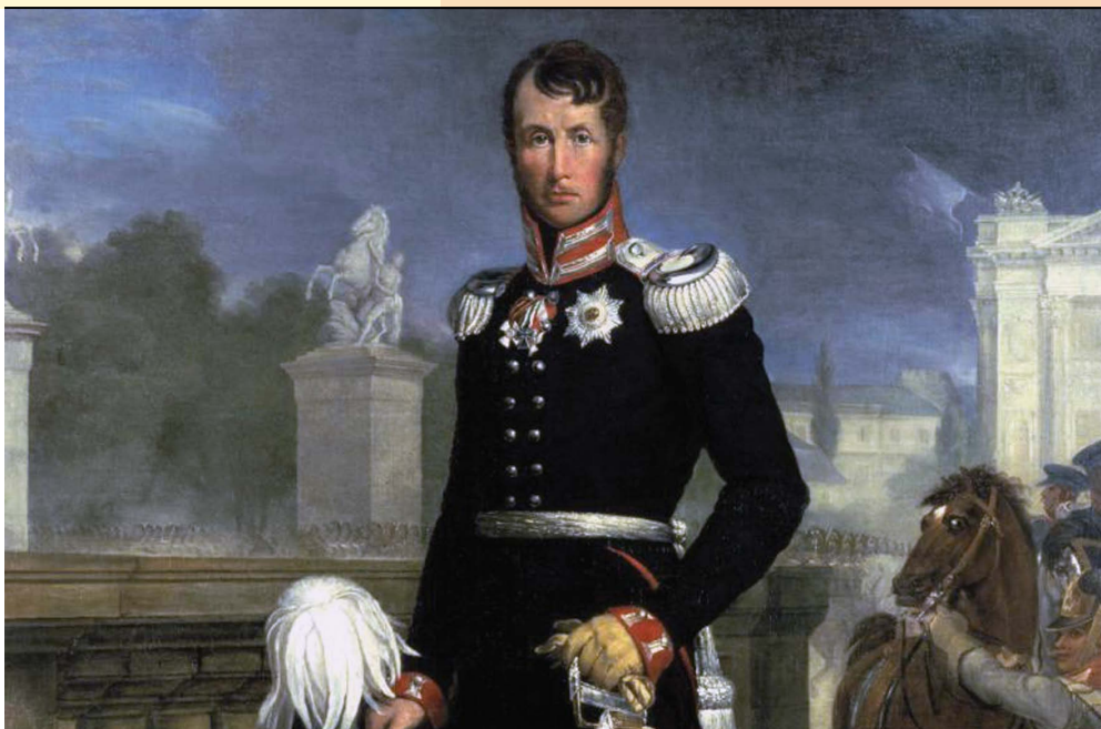
Пруски краљ Фридрих Вилхелм III (1770 – 1840)

„апсолутног рата” модел „реалног рата” који је настао на постојећем искуству, Клаузевиц закључује да због вишеслојне стварности и с њом повезане непредвидљивости замишљени модел није нити реалан, нити достижан, те да се њему у идеалном случају можемо тек приближити. Термин „апсолутни рат” често се у литератури меша и поистовећује са појмом „тотални рат”, који се појавио 1935. године и чији је творца био генерал Ерих фон Лудендорф, иначе изричито противник Клаузевицевој теорији. Ипак треба рећи да се „тотални рат”, онако како га је видео Лудендорф, може сврстати у свеобухватнији појам Клаузевицевог „апсолутног рата”.