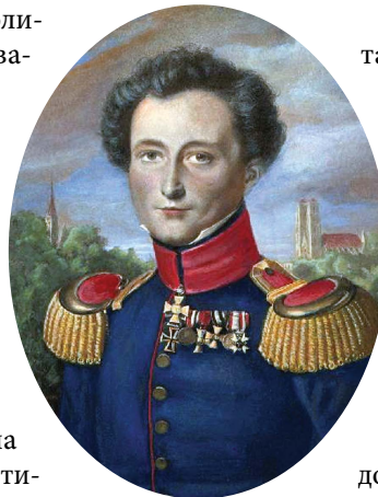
Карл фон Клаузевиц (1780–1831)

Следеће године у часопису Нова делона појавио се његов чланак усмерен на критику дела тадашњег чувеног војног писца Хајнриха фон Билова, који је покушавао да рат прикаже као неку врсту примењене математике, где је операције требало водити по одређеним шаблони-ма који гарантују успех. Управо тај чланак, који је анонимно написао, сматра се првим Клаузевицевим објављеним делом.