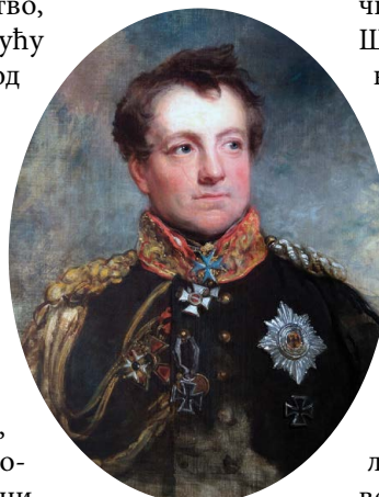
Август фон Гнајзенау (1760–1831)

Као штабскапетан и ађутант Клаузевиц је учествовао и у рату четврте коалиције против Наполеона 1806. године. После пруског пораза у двострукој бици код Јене и Ауерштата предао се француским снагама заједно са батаљоном рањеног принца Аугуста од Пруске тек након две недеље борби и потере за њима. Заједно са принцем Аугустом доведен је у Берлин и представљен Наполеону I. У кратком и опуштеном разговору Наполеон је тврдио да је одувек желео мир и да не разуме зашто му је Пруска објавила рат. Клаузевиц је касније превео ову тврдњу у максиму која гласи: „Освајач је увек мирољубив. Он би радо желео да у нашу земљу уђе без отпора”. Он је затим целу 1807. годину провео у француском заробљеништву, прво у Нансију, а затим у Соасону и Паризу. У том периоду анализирао је пораз пруске војске у Историјским исписима о великим рајним догађајима октобра 1806. године . По повратку из заробљеништва прикључио се кругу реформатора око Шарнхорста, Гнајзенауа и Бојена. Шарнхорст га 1809. године узима у Генералштаб, где се као један од најзначајнијих људи укључио у покренуте војне реформе и реорганизацију пруске војске. Тим реформама либерализован је приступ свим пруским грађанима у официрски кор, уведени су оштри критеријуми селекције базирани на знању и вештинама за напредовање у официрској служби, а на крају тих реформи и општа војна обавеза. У чин мајора Клаузевиц је унапређен 1810. године. Тада заузима дужности Шарн-