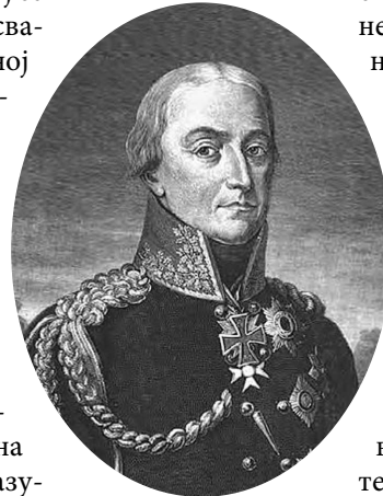
Фридрих фон Билев (1755–1816)

За исказану храброст у бици код Бородина руски цар Александар I одликовао је 1819. године Клаузевица Златним мачем за храброст