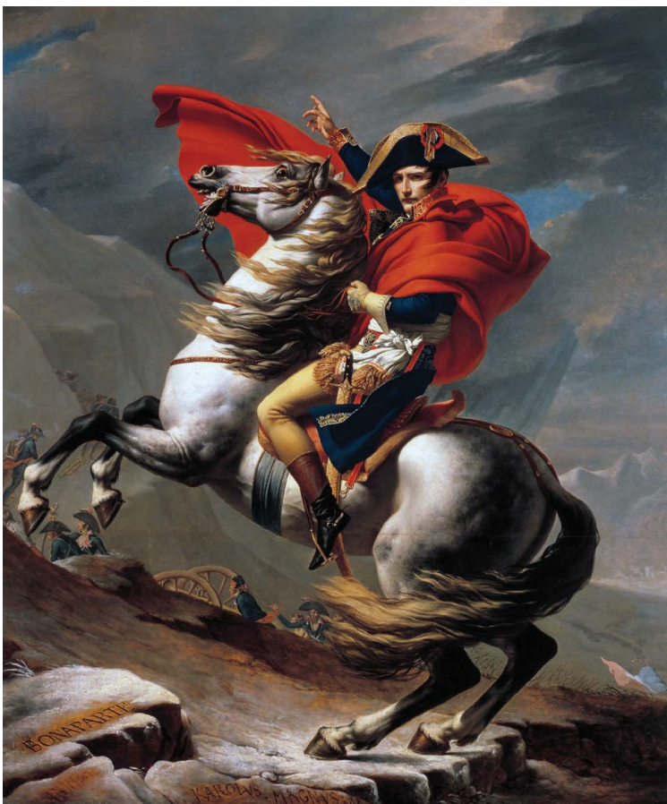
Наполеон прелази Алпе

Клаузевиц је заједно са принцем Августом доведен у Берлин и представљен Наполеону I. У кратком и опуштеном разговору Наполеон је тврдио да је одувек желео мир и да не разуме зашто му је Пруска објавила рат. Клаузевиц је касније превео ову тврдњу у максиму која гласи: „Освајач је увек мирољубив. Он би радо желео да у нашу земљу уђе без отпора”.