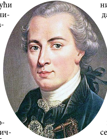
Имануел Кант (1724–1804)

Клаузевиц се до 1812. године и Наполеоновог похода на Русију држао егзистенцијалистичког тумачења рата, које се може уочити у његовом тада писаном Исцрпљеном документу . Тада је сматрао да је рат највиши облик самопотврђивања једног народа. То је било сасвим у духу времена када су Француска буржоаска револуција, као и догађаји који су из ње проистекли, довели до формирања великих националних армија заснованих на општој војној обавези, као и масовних герилских покрета општеномодног отпора (Шпа-