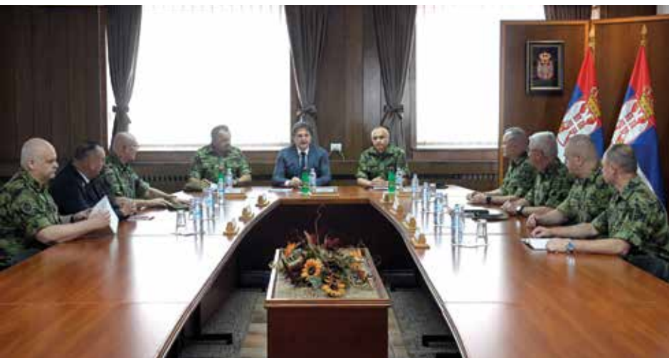
Министар Гашић у Команди Копнене војске у Нишу

– Опремању и развоју Копнене војске придаје се посебан значај, а тај тренд биће настављен и у наредном периоду уз подршку државног и војног