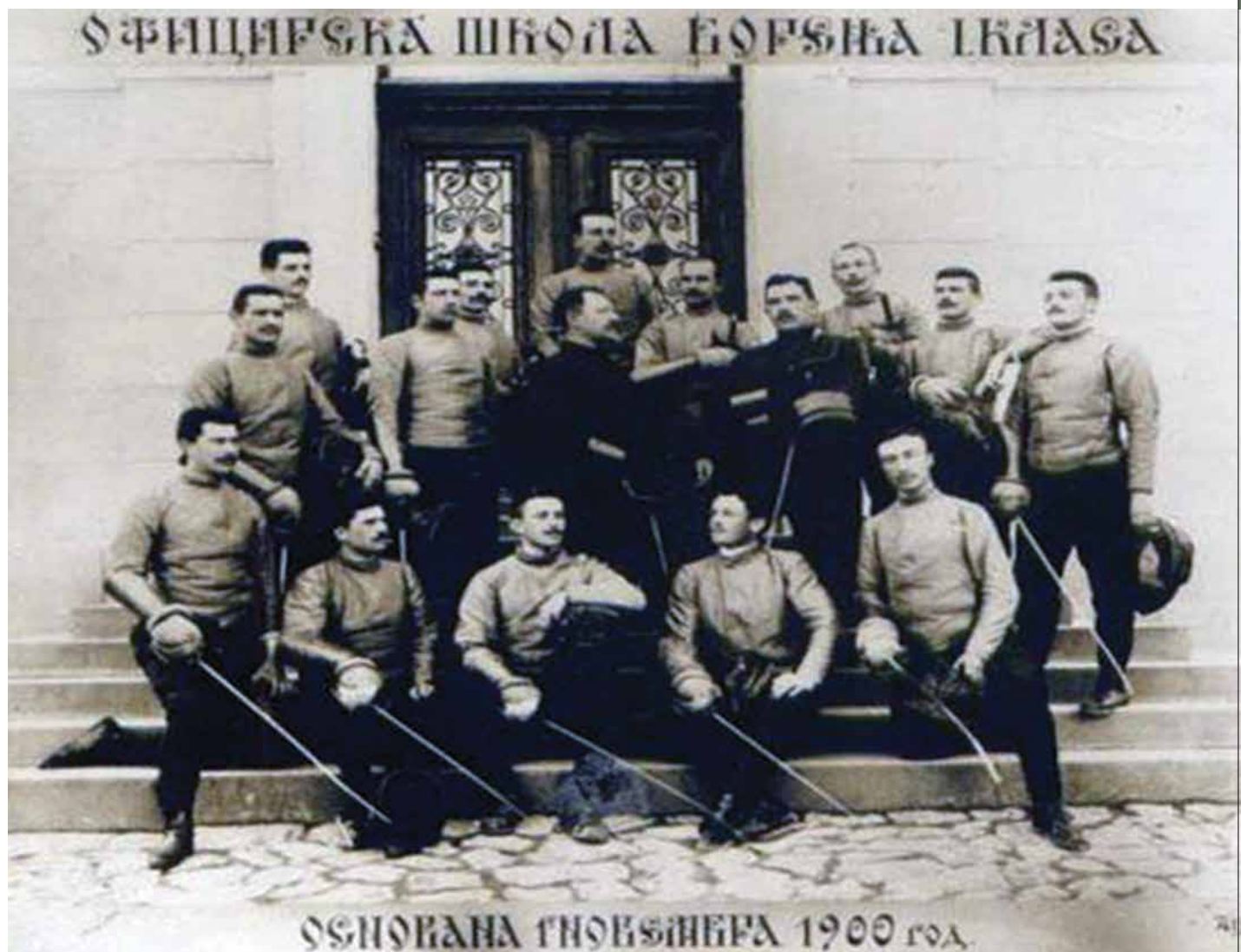
Полазници 1. класе Официрске школе бојења 1900. године