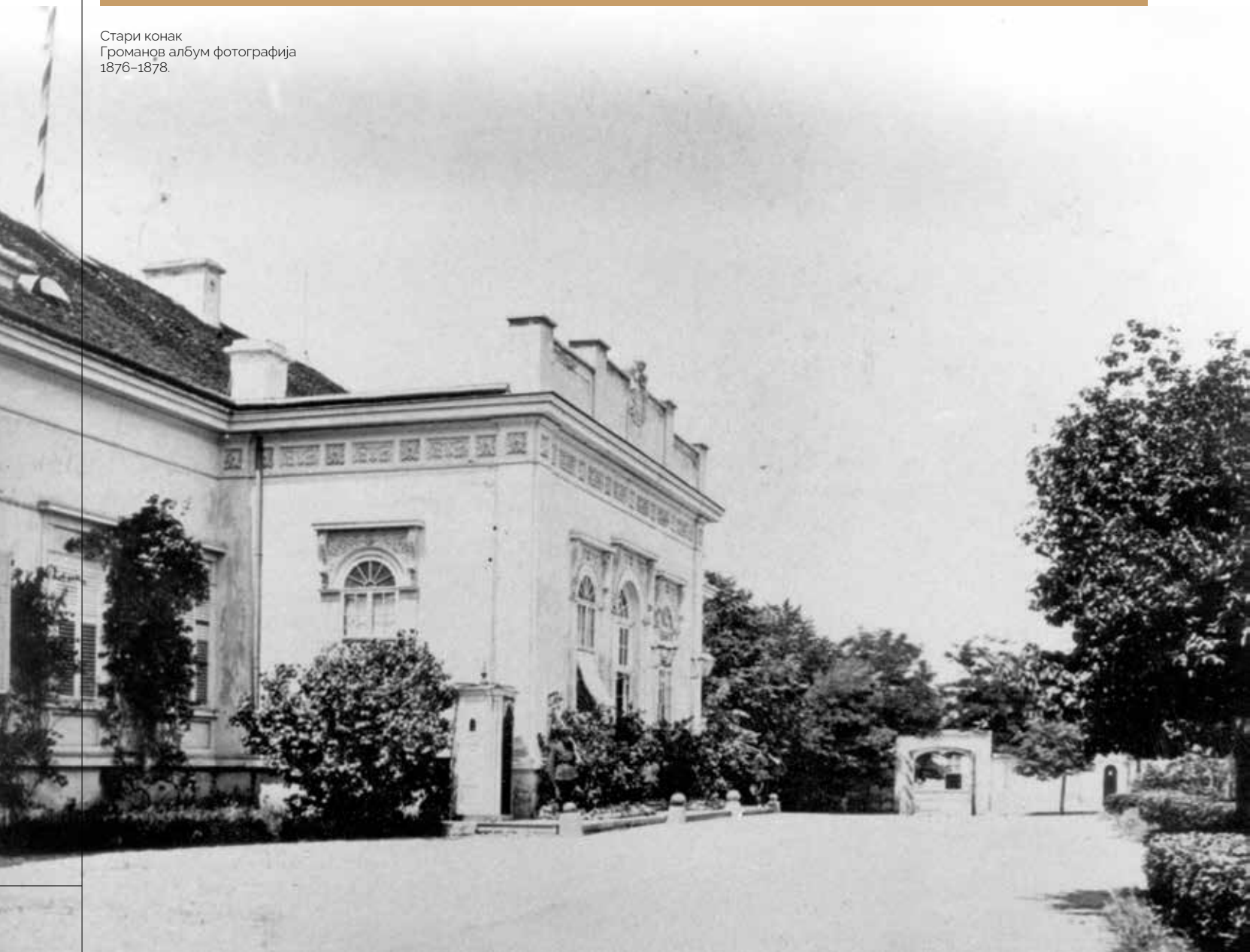
Стари конак Громанов албум фотографија 1876–1878.