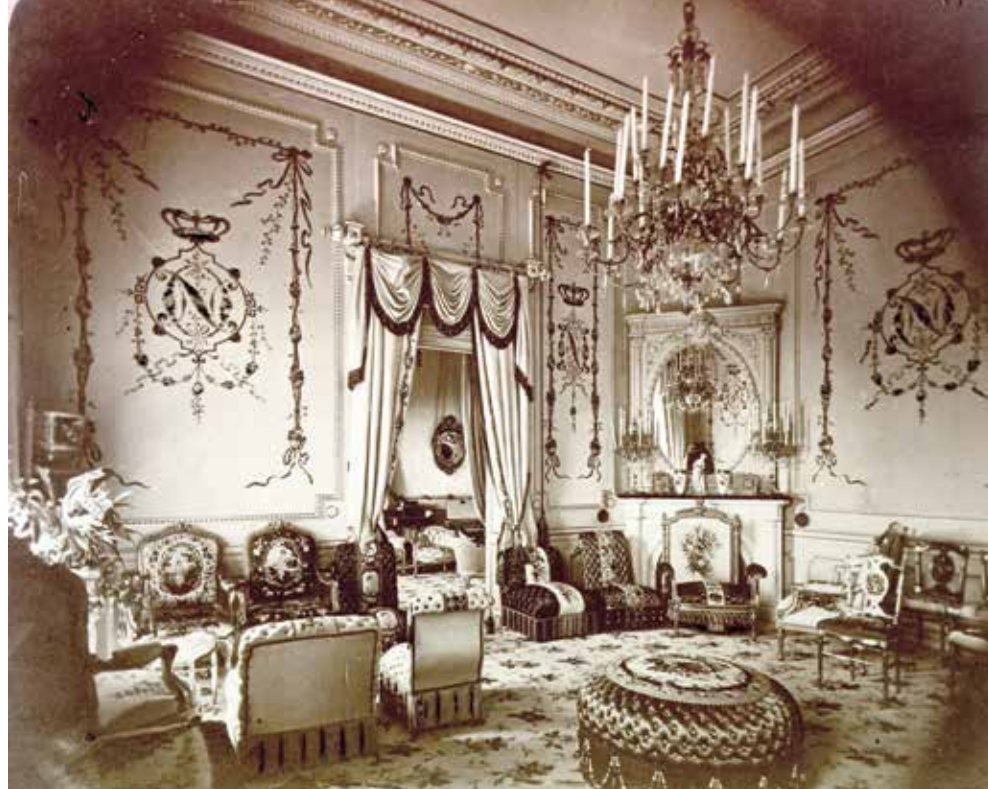
Ентеријер Старог конака. Громанов албум фотографија 1876–1878.