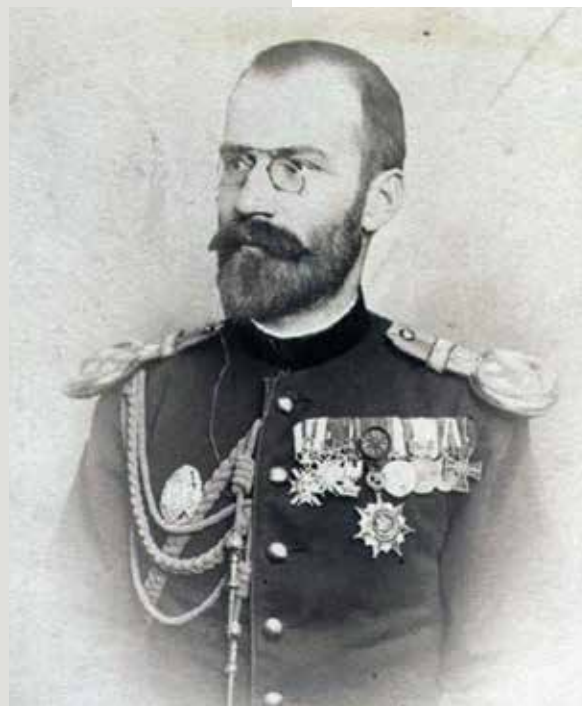
Генерал Михаило П. Рашић

Генерал Михаило Рашић рођен је 13. јуна 1858. у Алексинцу. По завршетку реалке у Београду ступио је у Војну академију 1874, као питомац 11. класе. Школовање је завршио 1880, када је произведен у чин артиљеријског потпоручника. Био је члан комисије за пријем пушака маузер-кока у Оберндорфу у Немачкој од 1882. до 1883. године. Дужност ордонанс-официра краља Милана обављао је од 1887. до 1889. године. Пошто је краљ Милан абдицирао 1889, наследио