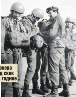
Провера пред скок 1977. године

ма неће бити потребне веће падобранске јединице, крајем 1959. по наредњу Генералштаба ЈНА 63. падобранска бригада је расформирана и од ње су формирана три самостална падобранска батаљона: 159. падобрански батаљон у Скопљу, 127. падобрански батаљон у Батајници и 148. падобрански батаљон у Церкљу.