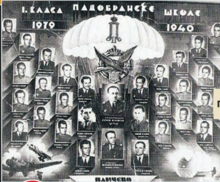
Прва класа Падобранске школе

У БРИГАДУ НЕ МОЖЕ СВАКО: 63. је једна од најбољих војних специјалних јединица у свету