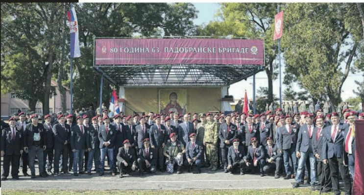
Ветерани са премијером и другим званичницима на прослави јубилеја

Наредбом ВКОС бр. 200 од 5. фебруара 1953. у Шапцу је формирана 63. падобранска бригада. Марта следеће године је враћена у Нови Сад. Због тадашње процене да у будућим ратовима