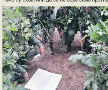
ОДБРАНА ОТАЏБИНЕ: 1999. је чувана граница