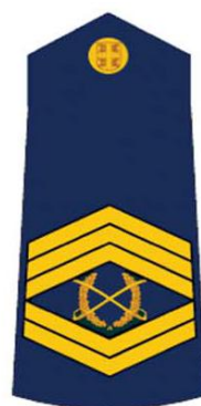
заставник прве класе