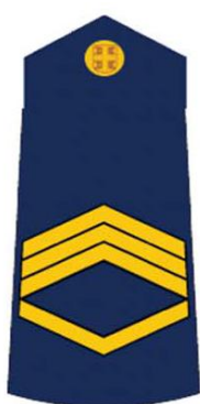
старији водник прве класе