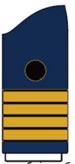
капетан бојног брода