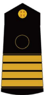
капетан бојног брода